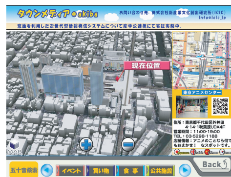
次世代型サービス3DMAP