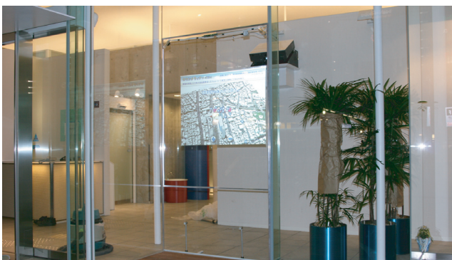
秋葉原駅前有料トイレ オアシス@akiba